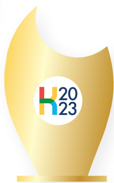
JAVNI HOLDING MARIBOR